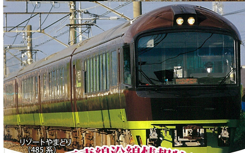
リゾートやまどり(485系)