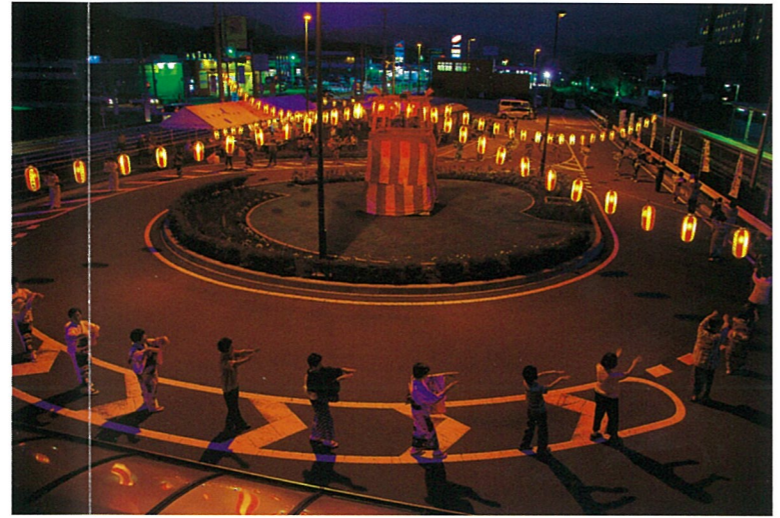
【受賞名】東吾妻町議会議長賞 【題名】輪になって 【撮影場所】群馬原町駅

「東吾妻盆おどり」 東吾妻町の夏の風物詩といえば「東吾妻盆おどり」毎年お盆の時期に開催され、世代間・地域内の交流や地域の活性化のため多くの町民が参加します。 櫓の周りを大きな円で囲み、浴衣姿の子どもから大人までが一緒に輪になって優雅に夏の夜を舞う姿は実に美しいです。