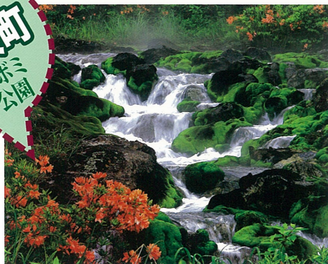
【受賞名】中之条町長賞 【題名】美しき調和 【撮影場所】チャツボミゴケ公園