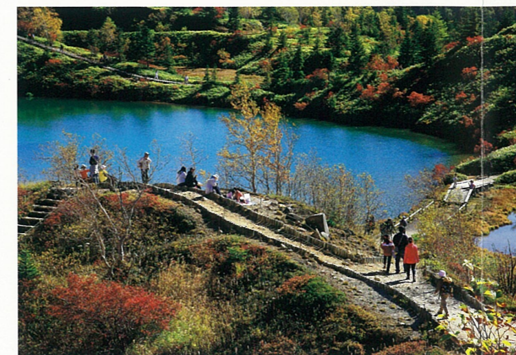
【受賞名】草津町長賞 【題名】秋晴れの弓池 【撮影場所】草津白根山 弓池

山頂の標高2162メートルの草津白根山。その麓一帯の湿原には初夏のワタスゲや秋の紅葉が美しく大自然を満喫することができます。おだやかにさざ波の立つ湖面をたたえる弓池。周遊する散策道は人気のスポットです。