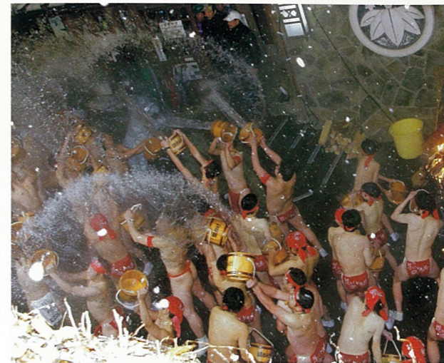
【受賞名】川原湯温泉協会長賞 【題名】お祝いだー 【撮影場所】長野原町川原湯温泉

毎年厳冬の朝に川原湯温泉で行われる奇祭。湯かけ太鼓の合図とともにまつりが始まり、儀式的後に紅白に分かれた勇み姿の若者たちが、お湯を掛け合う。辺りは湯煙と参加者たちの熱気であふれかえる。