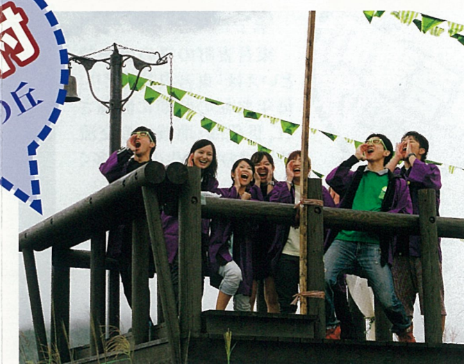
【受賞名】吾妻行政事務所長賞 【題名】絶叫 【撮影場所】第7回キャベチュー