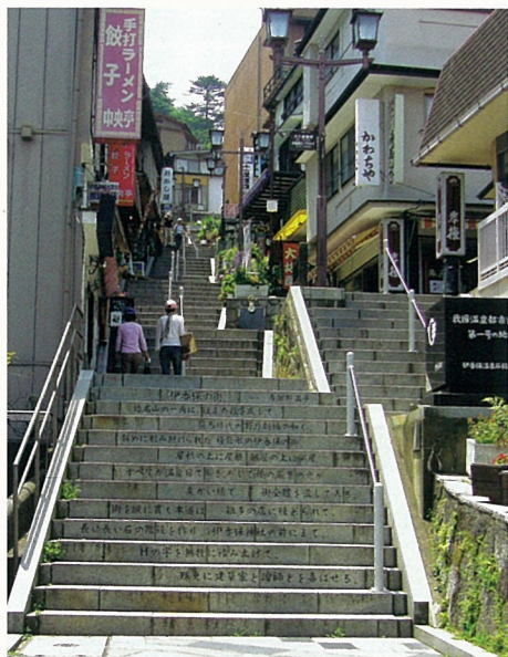
【撮影場所】伊香保温泉「石段街」