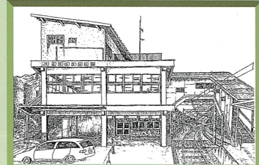
長野原草津口駅(旧駅舎)