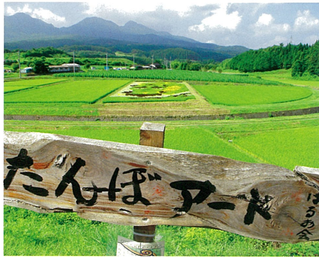
【受賞名】高山村議会議長賞 【題名】三並山と稲田 【撮影場所】たんぼアート

道の駅「中山盆地」南眼下に毎年、村・県内外の人々が集い、五色の稲穂による「干支」をモチーフにしたたんぼアートを創作しています。見学期間としては6月の田植期から10月下旬の稲刈りまでです。 (見どころは、6月下旬から7月中旬)